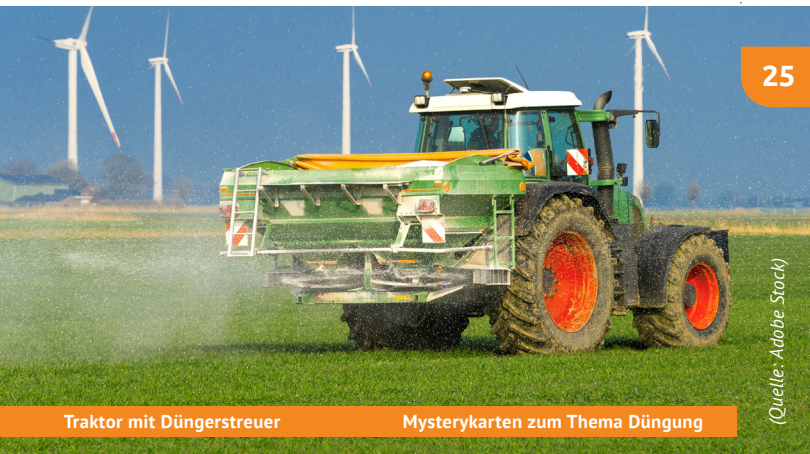
Traktor mit Düngerstreuer