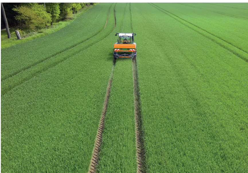
Düngerstreuer werden für die Ausbringung von Mineraldünger verwendet.

Um eine Überdüngung und Umweltbelastungen zu vermeiden, die Pflanzen aber dennoch ausreichend mit Nährstoffen zu versorgen, gibt es die Düngerverordnung. An sie müssen sich die Landwirt:innen per Gesetz halten. Hier sind z. B. Höchstmengen an Dünger je Fläche und Sperrfristen für die Aus-