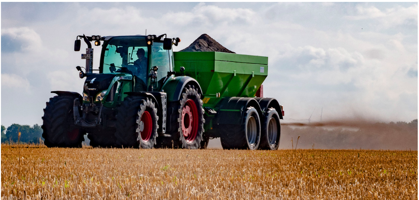
Kalkdünger zur Bodenverbesserung wird als feines Pulver ausgebracht. (Quelle: Agri V)

Magnesium ist Bestandteil des Blattgrüns (Chlorophyll) und somit wichtig für die Fotosynthese. Bei einer Unterversorgung werden vor allem ältere Blätter gelb, die Blatt-Adern bleiben grün. Zu viel Magnesium kann einen Calcium-Mangel hervorrufen.