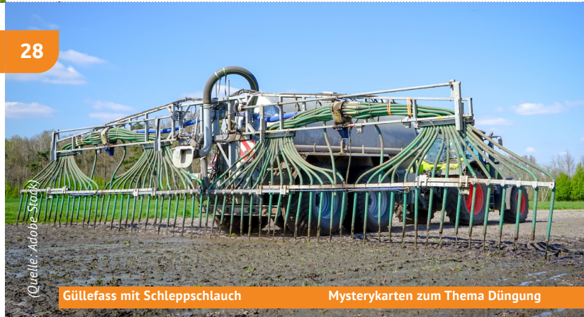
Güllefass mit Schleppschlauch