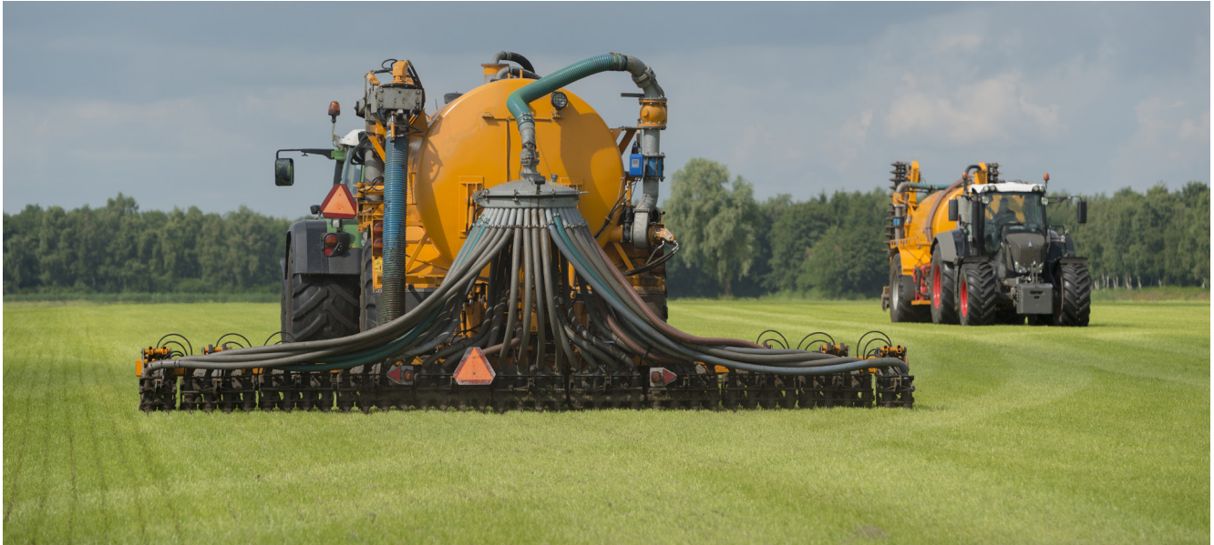
Moderne Maschinen arbeiten die Gülle direkt in den Boden ein. So gehen kaum Nährstoffe über die Luft verloren.